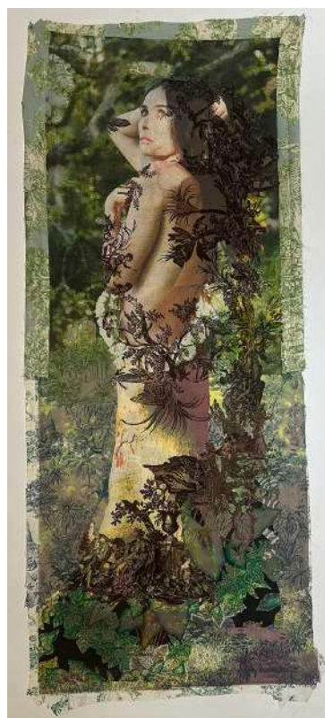
Demi Moore (actrice) en arbre (d'après Cranach l'ancien) sur un assemblage de toiles marron, verte et bleue).2017. Impression unique à jet d'encre sur tissu imprimé, fil. Collection de Tim Hailand

Elle retrace plus de dix ans de recherches artistiques.