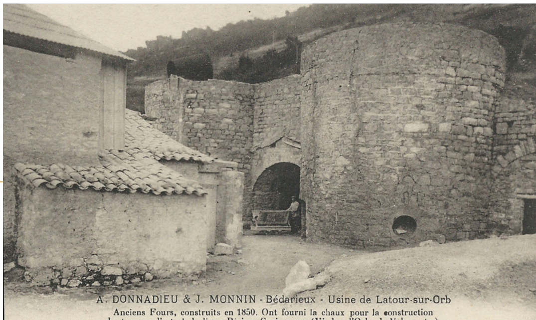
A. DONNADIEU & J. MONNIN - Bédarieux - Usine de Latour-sur-Orb Anciens Fours, construits en 1850. Ont fourni la chaux pour la construction des travaux d'art de la ligne Béziers-Graissessac. (Viaduc d'Orb, de Valre, etc.)

Dès lors, la région des Hauts Cantons de l'Hérault, qui était très pauvre, connut un développement économique sans précédent.