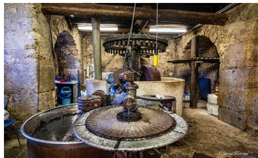
Moulin oléicole de Bargemon, Var