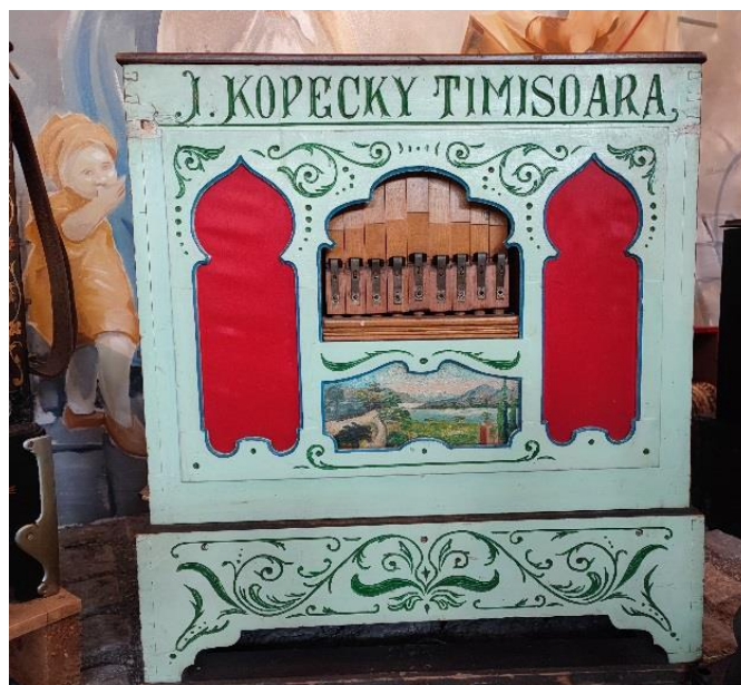
Orgue Roumain de 1925 Dernière acquisition du musée

Le village des Gets a toujours accueilli des passionnés de musique mécanique de toute l'Europe depuis 40 ans, dont un moment fort lors du festival de 1990 après la chute du mur de Berlin, avec la venue de participants des « Pays de l'Est » !