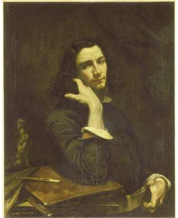
Gustave Courbet : autoportrait Musée d'Orsay - Paris

L'histoire du 19 e siècle et du début du 20 e siècle est particulièrement riche en bouleversements sociaux et artistiques. Les artistes formulent ainsi, à travers leurs propres représentations, la quête de reconnaissance de leur création en parallèle de l'émancipation du système des beaux-arts et du rejet de l'académisme des Salons. On peut penser que d'autres y mêlent subtilement quête picturale et introspection psychologique.