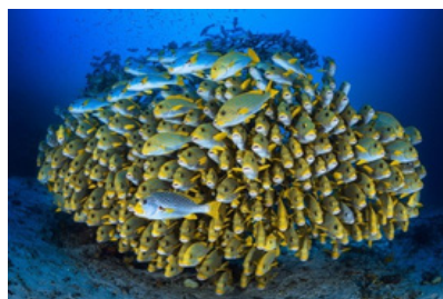
Unity is Strength, 2021 Raja Ampat, Indonésie Mention du jury 2021 du Prix de Photographie Environnementale catégorie « Incroyable biodiversité »