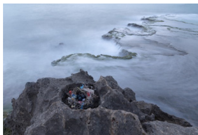
Traces of Life in the Realm of Death, 2021 Israel Lauréat 2021 du Prix de Photographie Environnementale catégorie « Biodiversité en crise »

Pour prolonger l'expérience de "À la rencontre du vivant", une série de rencontres inspirantes est à découvrir chaque mois sur GoodPlanet Mag avec des interviews dans lesquelles scientifiques, artistes, activistes, nous parlent sans pudeur de leur rapport intime avec le vivant. Des contenus dédiés à la sensibilisation du plus grand nombre seront également publiés sur les réseaux sociaux de la Fondation chaque lundi à compter d'avril, sous le hashtag #ALaRencontreDuVivant . Objectif? Donner à comprendre de façon accessible et pédagogique les enjeux, les ordres de grandeur, et les clés pour préserver la biodiversité.