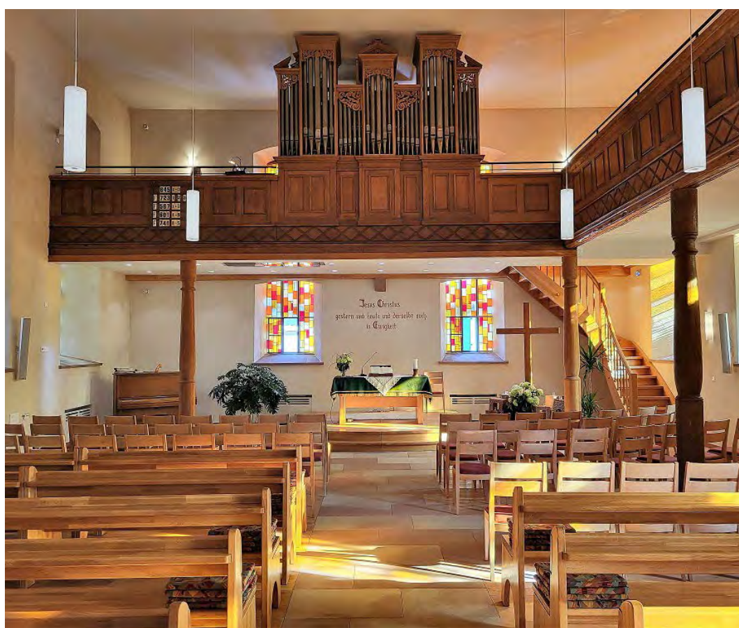
Eglise protestante de Seebach

Montant de la collecte : 148 581 € pour 408 dons