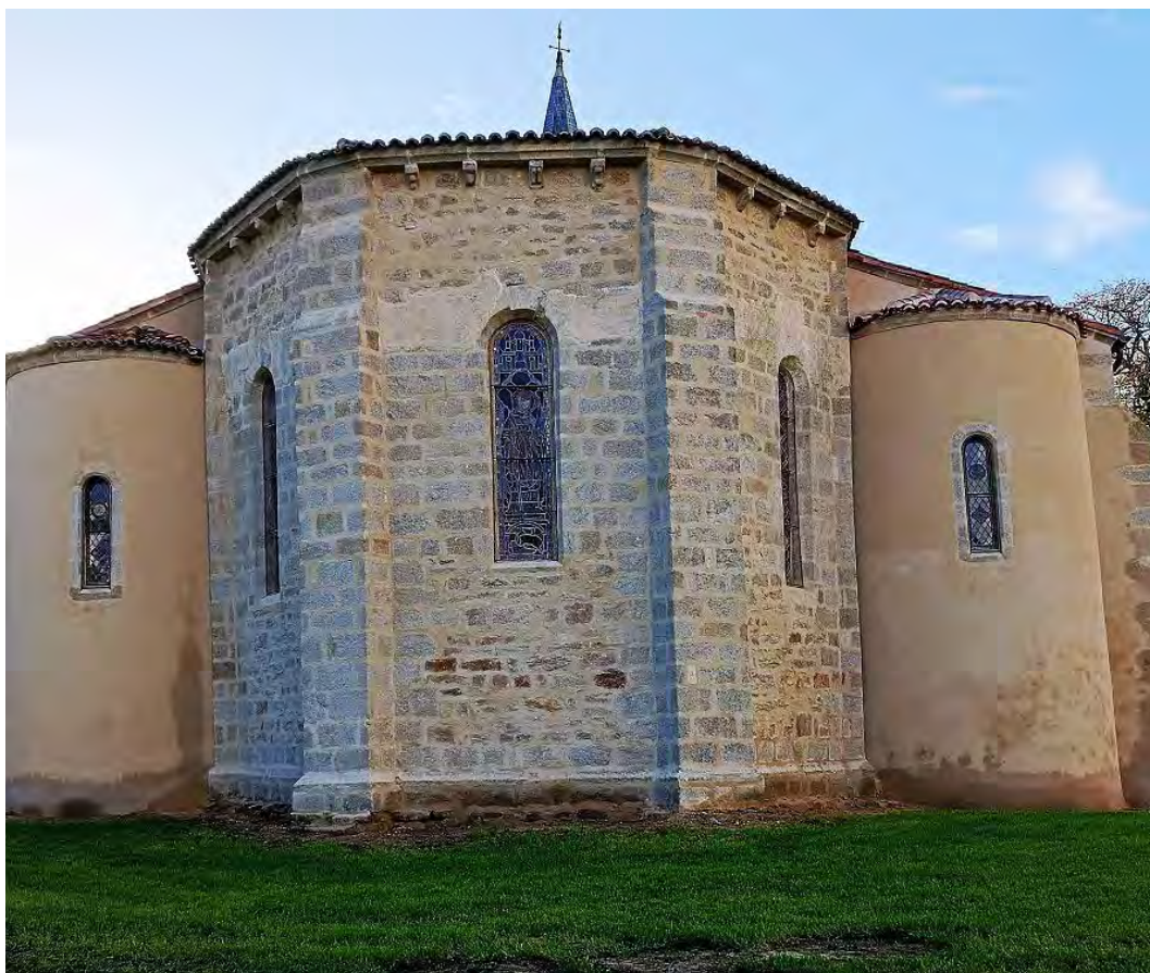
Eglise St-Saturnin

Montant de la collecte : 12 580 € pour 46 dons