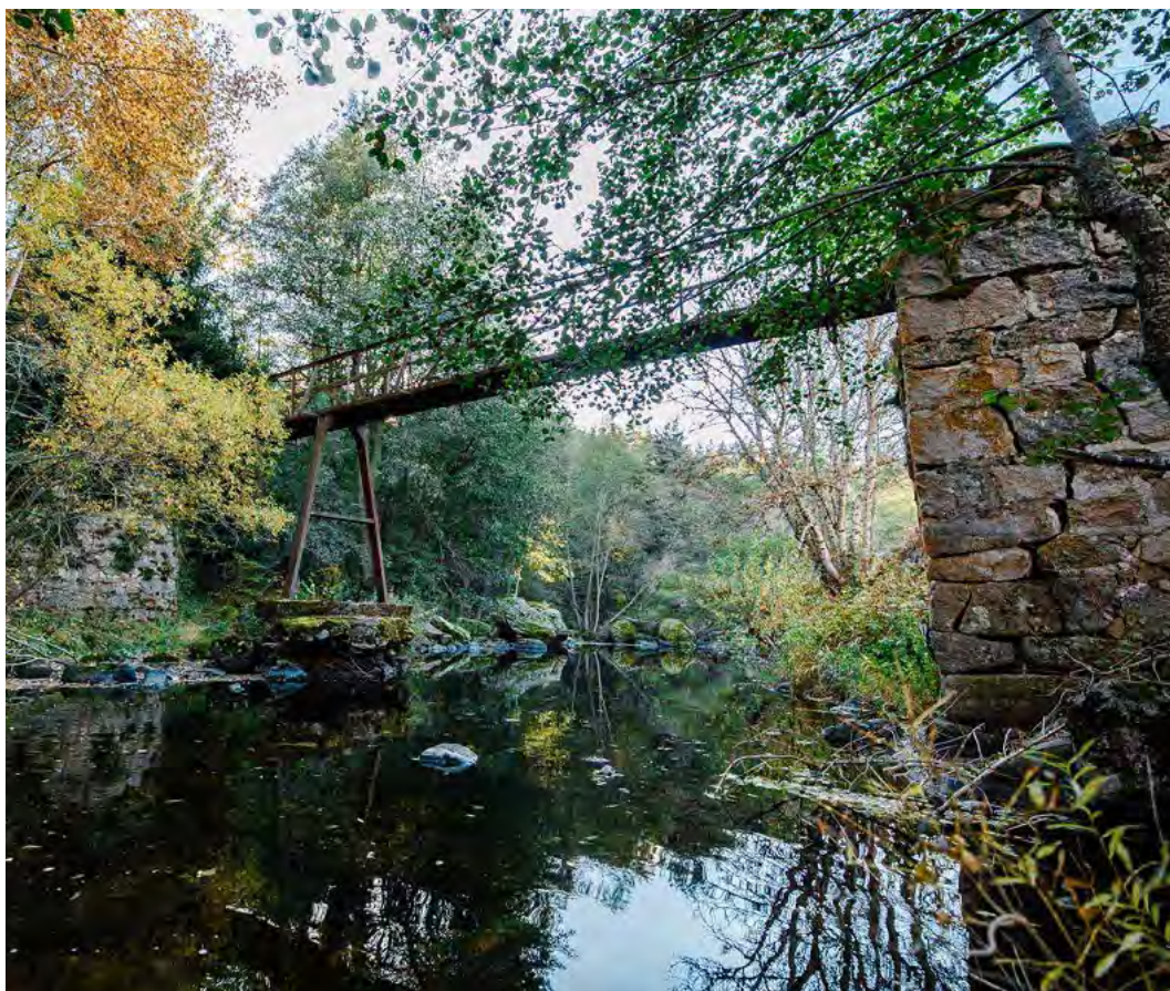
Passerelle d'Ussel à Auroux

Montant de la collecte : 22 420 € pour 105 dons