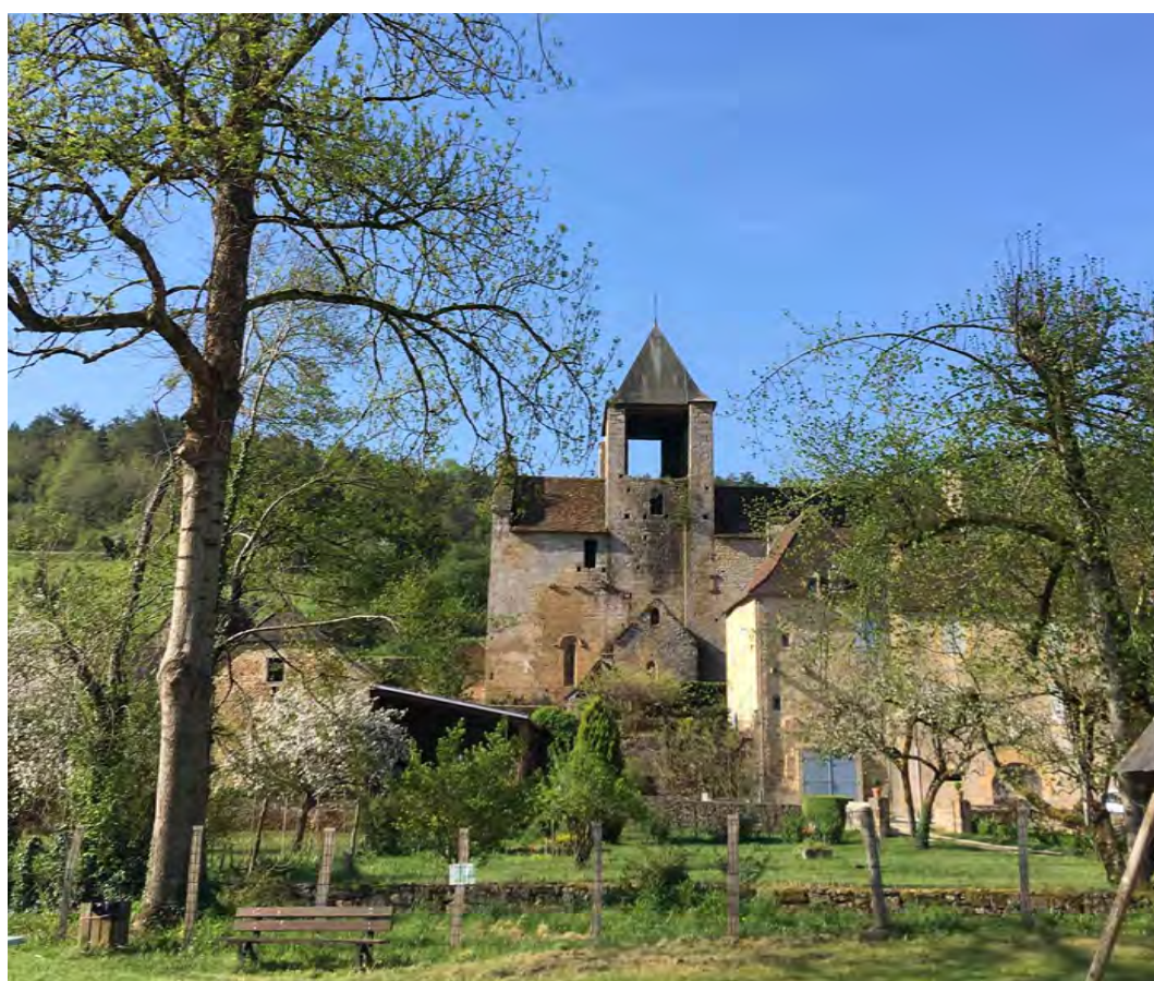
Eglise St-Etienne d'Auriac-du-Périgord

Montant de la collecte : 29 030 € pour 72 dons