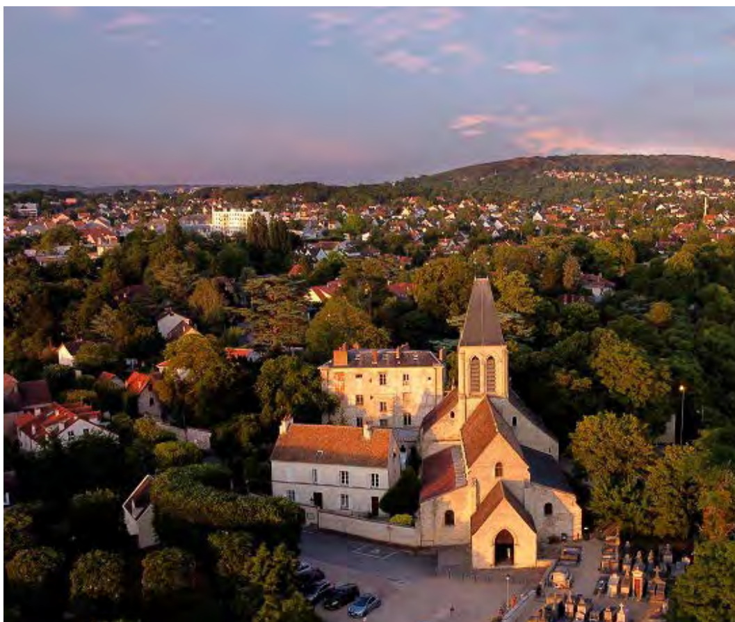
Eglise St-Martin d'Herblay-sur-Seine

Montant de la collecte : 55 990 € pour 169 dons