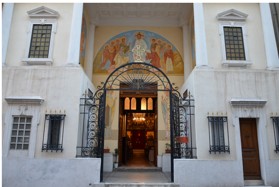
Eglise Saint-Nicolas de Myre