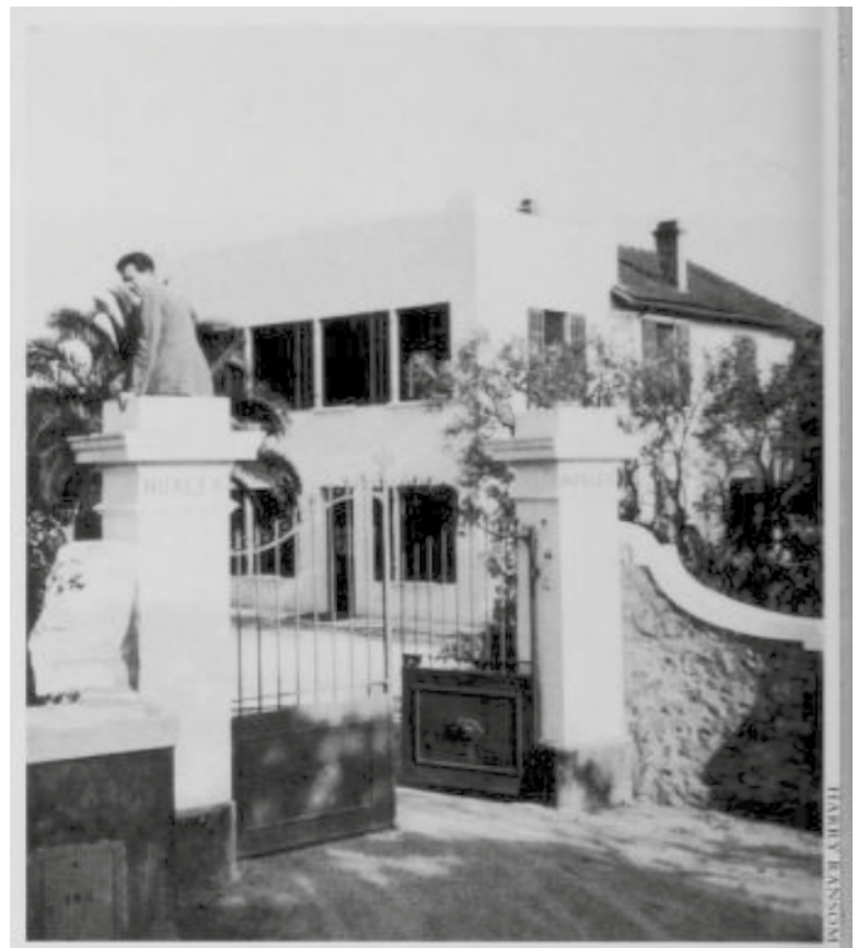
Villa Huxley