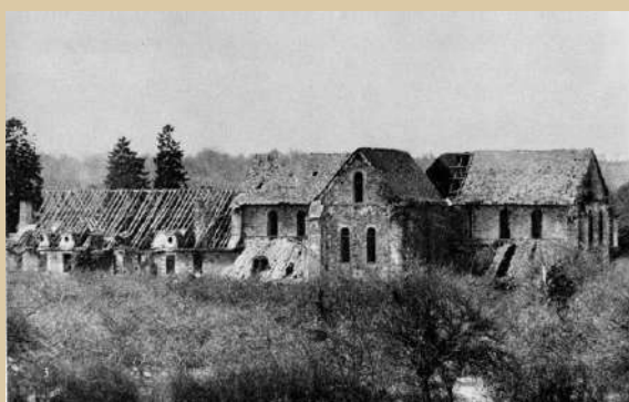
L'abbaye en 1954