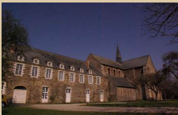
L'abbaye en 2021